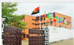
Séminaire sous-régional à Douala