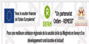
Pour une meilleure cohésion régionale de la société civile du Maghreb en faveur d'un développement rural durable et inclusif