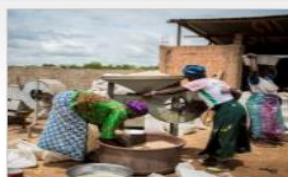
Renforcer le pouvoir économique des femmes par le développement de l'Economie...