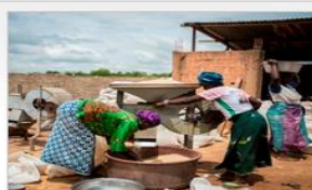
Note de cadrage de la conférence sur la loi de L'Economie Sociale et...