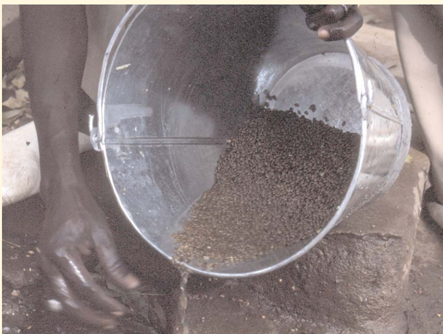
Elimination des graines vaines par flottation

Les graines de citronnier sont extraites par pression du fruit coupé en deux, puis mises à sécher à l'ombre. Il est relativement difficile d'obtenir des graines de citronnier car les agriculteurs vendent les fruits au marché. Les graines d' anacardier n'ont besoin d'aucune préparation autre que les séparer du faux fruit.