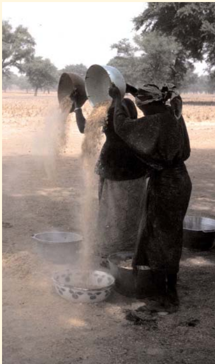
Vannage des gousses pilées pour récupérer les graines