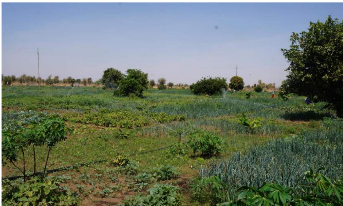
Photo 3: Association arbre et culture dans le périmètre des femmes de Wendou Bosséabe

brousse et la divagation des animaux, et l'entretien des plants par des éclaircissements, émondages, élagages et tuteurages.