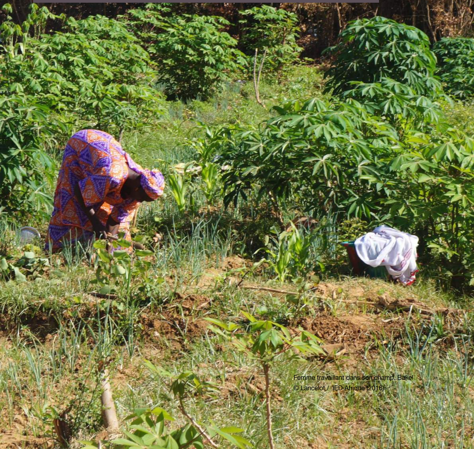
Femme travaillant dans son champ, Bakel

Les systèmes de production actuels sont le fruit d'une mutation des systèmes traditionnels lié aux contraintes naturelles (climatiques surtout), mais aussi à l'accroissement de la population occasionnant une demande plus importante en terres agricoles. A la suite surtout des sécheresses des années 1970, les comportements ont changé marqués par la nécessité d'un meilleur investissement dans le secteur de l'agriculture. Aujourd'hui, avec l'apport de l'encadrement technique et de la recherche, diverses techniques sont nées, importées ou issues de l'amélioration de techniques traditionnellement pratiquées et prises en compte dans les nouveaux paquets technologiques. C'est par exemple le cas des cordons pierreux qui traditionnellement sont pratiques sans tenir compte des courbes de niveau. Elle a été améliorée avec l'utilisation du niveau à eau qui permet de suivre les courbes de niveau et d'améliorer l'efficacité des aménagements.