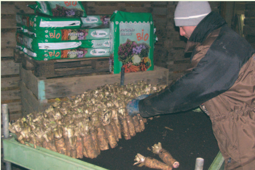
Plantation des racines pour le forçage.

reprises et disposées directement dans les bacs de forçage. Cette technique est intéressante en l'absence de chambre froide car peu coûteuse ; cependant elle entraîne une pointe de travail à la plantation, comme pour les couches, et de la manutention.