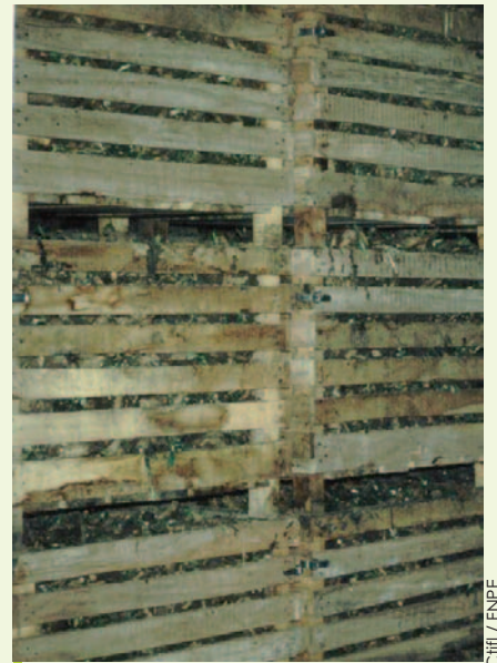
Stockage des racines en pallox en chambre froide après arrachage.

En culture conventionnelle, pour une production plus précoce, les semis débutent à la mi-avril avec une bâche de protection qui protège contre le froid et le risque des montées à graines. En agriculture biologique, il est difficile d'envisager de telles techniques compte-tenu des problèmes de désherbage que cela entraîne en raison de l'absence de faux-semis et de la croissance accélérée des mauvaises herbes sous la bâche.