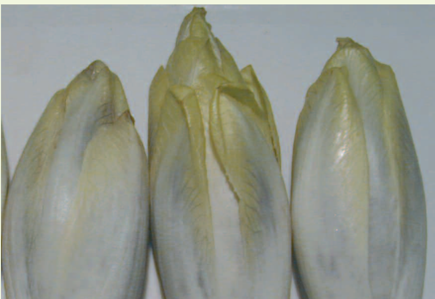
Attention, l'absorption de grandes quantités d'azote ammoniacal donne des endives gris bleu, non commercialisables.

■ en caissettes dans un terreau homologué composé de tourbe et compost, humide (deux à trois mois). Les racines sont plantées dans des caissettes préalablement remplies de six à huit centimètres de terreau de forçage humidifié. Les caissettes sont disposées sur une pâture par exemple, et protégées du gel par des tôles ou une bâche. Les caissettes sont