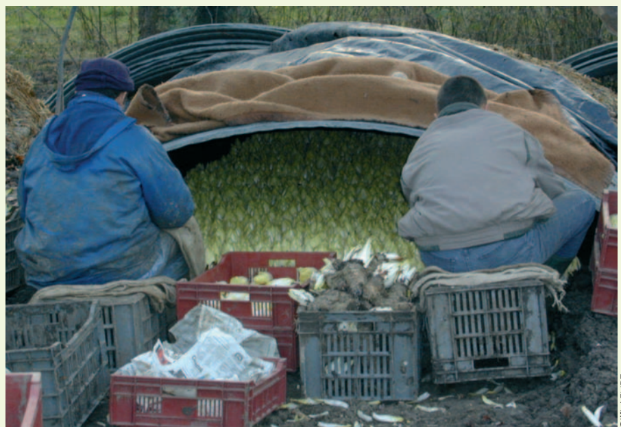
Forçage en couche.

Les couches sont des bandes de terre d'une douzaine de mètres de long sur deux mètres de large situées à l'extérieur ou à l'abri sous un hangar. Le sol ne doit pas être asphyxiant, ni trop filtrant ; l'idéal est un limon sableux. Chaque année en été, la terre est enrichie de fumier ou d'un amendement organique et ensemencé d'un ray-grass. Chaque couche dispose d'un système de chauffage du sol et d'un système d'irrigation. La difficulté des installations en couche est d'obtenir une homogénéité de température