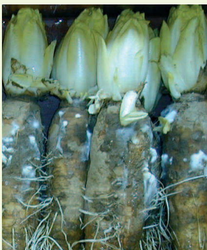
Sclerotinia , le principal parasite dommageable pour la production.

Certains producteurs d'endives biologiques cultivent la totalité de leurs racines, mais il est souvent judicieux de