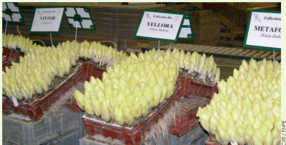
Trois groupes principaux de variétés se distinguent : les variétés "précoces", les "normales" et les "tardives".