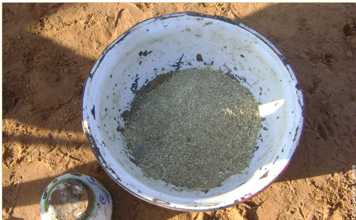
Ration de son pour le bétail

En comparaison avec d'autres capitales en Afrique de l'Ouest, la ville de Niamey dispose d'un secteur de transformation laitière dynamique en raison d'une forte consommation locale. Elle compte trois unités de transformation laitière de type industriel, et plusieurs autres unités de type semi-industriel ou artisanal (y compris de type mini laiteries).