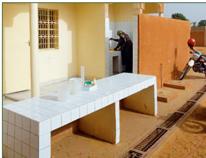
Quai de réception du lait au centre de Kollo

• Concernant l'impact de la collecte quotidienne de lait cru sur les revenus et pratiques des ménages, il reste à analyser plus précisément les effets de la vente de lait cru sur l'activité des femmes, ainsi que l'impact nutritionnel au niveau des ménages (en particulier sur les enfants en bas âge) .