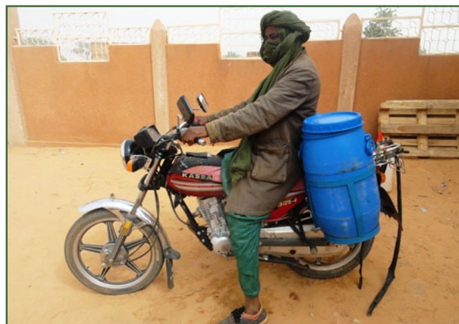
Collecteur de lait

du ménage ont été augmentés, ce qui a permis de faire face plus aisément aux besoins quotidiens (alimentation, scolarisation, frais divers). Les femmes, libérées dans certains cas de la contrainte de la vente de fromage et de lait caillé au porte à porte ou sur des marchés éloignés, a pu développer d'autres activités génératrices de revenus, avec ou sans appui du projet. Celles qui souhaitent continuer leur activité ont pu le faire grâce aux traites du soir qui leur étaient réservées.