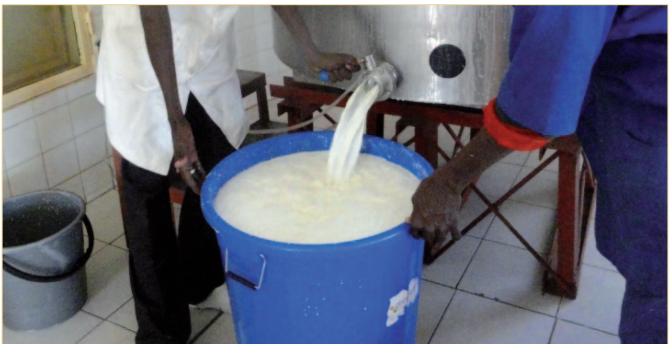
Livraison de lait