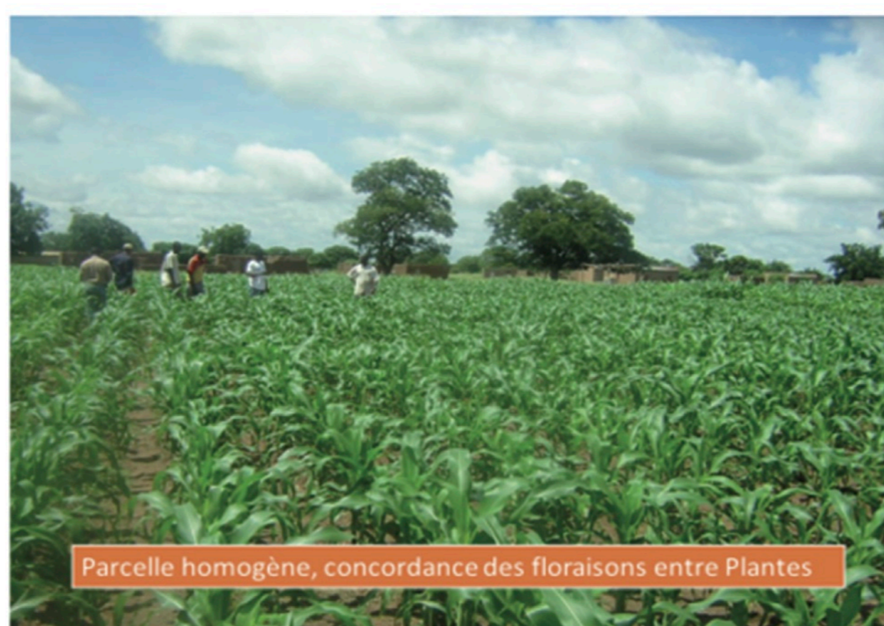
L'apport des engrais permet de faire des bons rendements