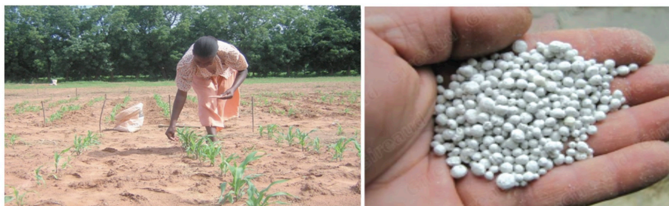
Ouvrir les raies a 10cm des poquets appliquer l'engrais dans les raies et bien refermer avec de la terre