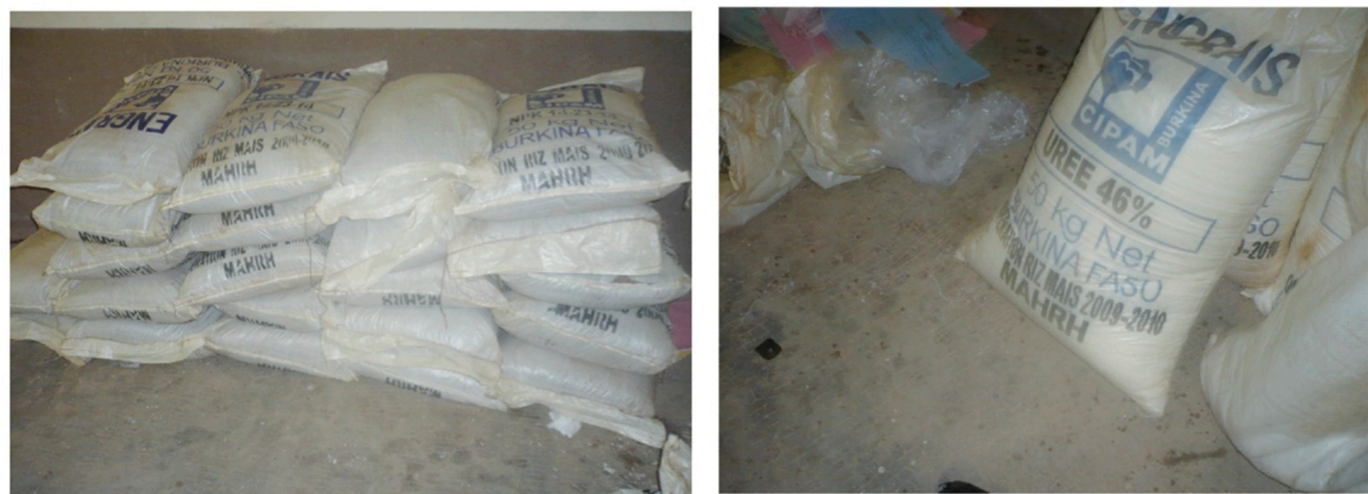
Le choix de l'engrais de qualité est un facteur important pour réussir une bonne production de maïs