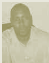
Baba Maiga Sahel Eco, Mali

« Après la formation, les pasteurs ont réalisé que maintenant, ils ont eux-mêmes les compétences pour défendre leurs propres intérêts... Ils ont décidé qu'il était nécessaire d'établir une association qui rassemblerait toutes les associations du cercle de Bankass. Nous les avons mis en contact avec la Chambre d'agriculture et ils ont fondé une association nommée la Coordination des Organisations Professionnelles d'Éleveurs (COPE) du cercle de Bankass. »