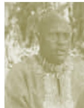
Mogolle Haibor Rendille 41

« Si l'accès au marché est facilité et si notre mode de vie est soutenu, nous n'avons pas besoin de secours en cas de famine. Nous n'avons besoin de l'aide de personne. En fait, nous pourrions payer des impôts et soutenir le gouvernement. »